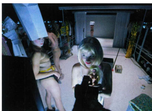
De actrices werken zwijgend voor de camera's