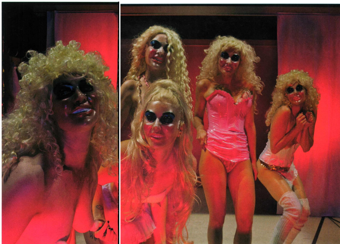
Een scala aan verleidelijke vrouwfiguren: 'Het is een soort fuik, je ontsnapt er niet aan'